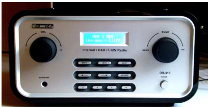
Übersichtlich angeordnete Bedienelemente: Der neue Multimode-Empfänger DR 315 von Albrecht.