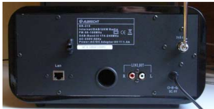
Der LAN/WLAN-Anschluss und der Ausgang des Bassrohres sowie die Cinch-Buchsen sind gut zu erkennen.